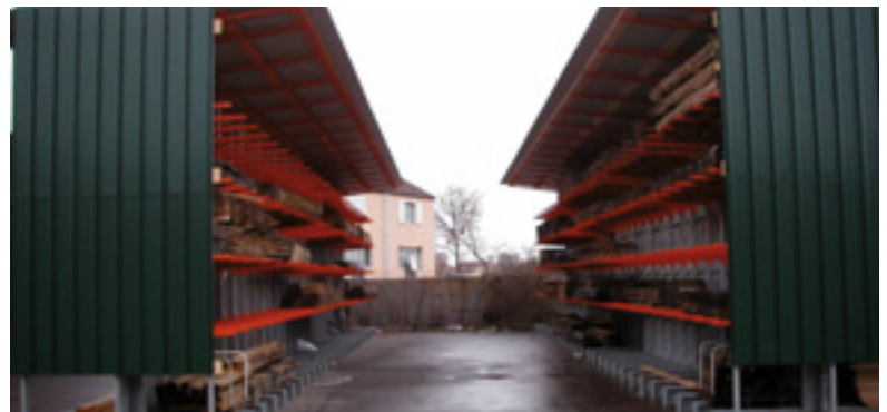
Mit Rückwand und Dach als Witterungsschutz