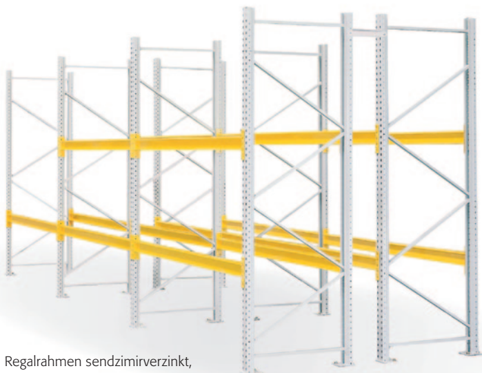
Regalrahmen sendzimirverzinkt, Standardfarbe Traverse lichtgrau RAL 7035