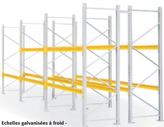
Echelles galvanisées à froid - Lisses Gris clair RAL 7035 (standard)