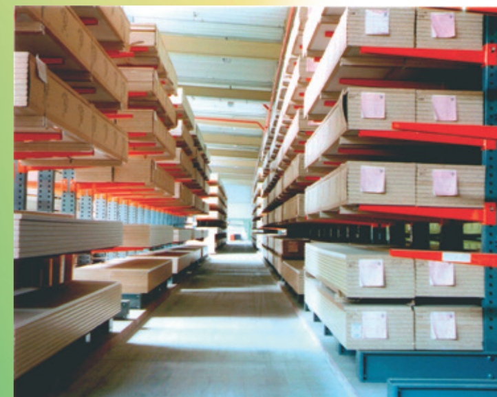
Rayonnage cantilever pour panneaux de particules

Inspection rayonnage cantilever conforme à la norme DIN EN 15635