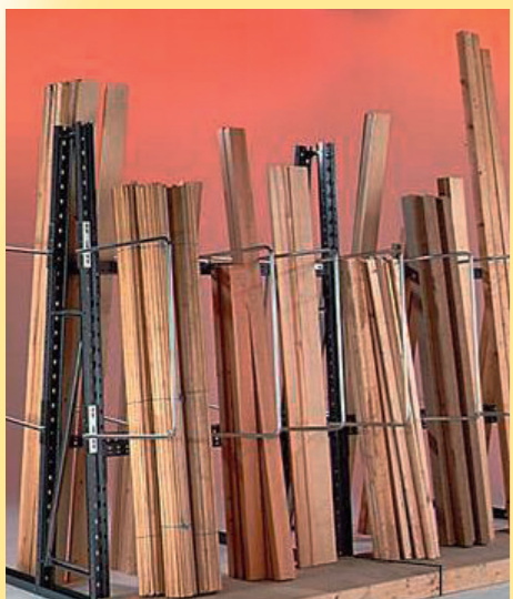
Rayonnage vertical à baquettes et profils