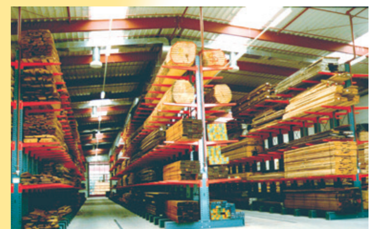
Stockage du bois