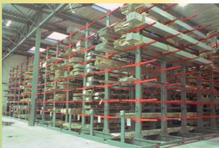
Rayonnage mobile charge lourde pour produits longs