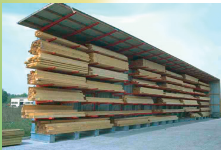
Rayonnage cantilever pour l'extérieur avec toit