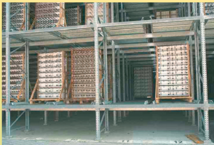
Rayonnage dynamique charge lourde