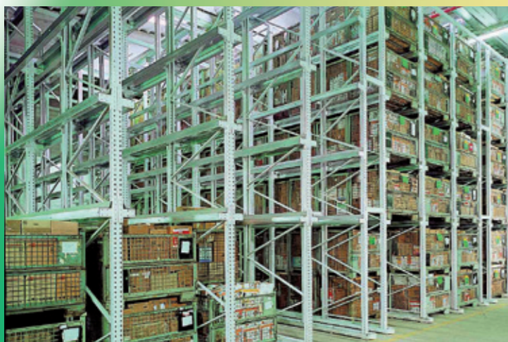
Rayonnage à accumulation