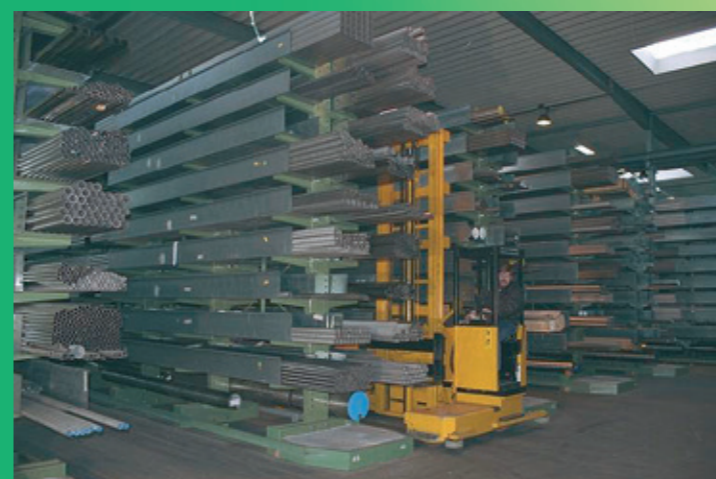
Rayonnage cantilever pour cassettes de profilés en acier