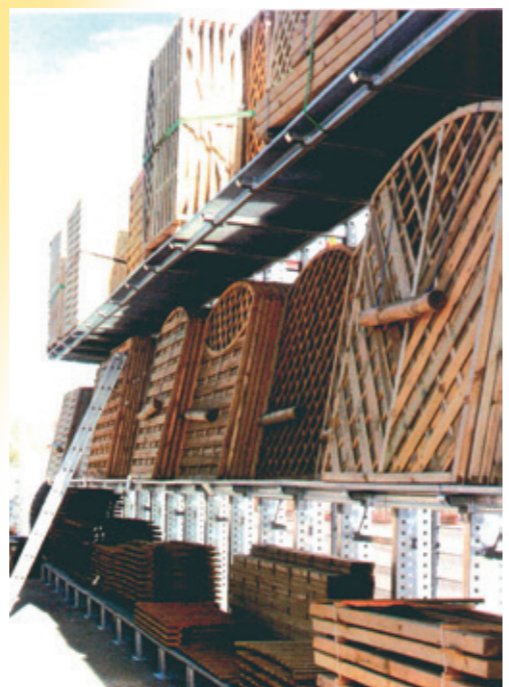
Rayonnage cantilever pour bois de jardin

ELVEDI fait partie des fournisseurs leaders dans la technique de stockage moderne. Leader grâce, entre autres, à la technique de rayonnage clés en main.