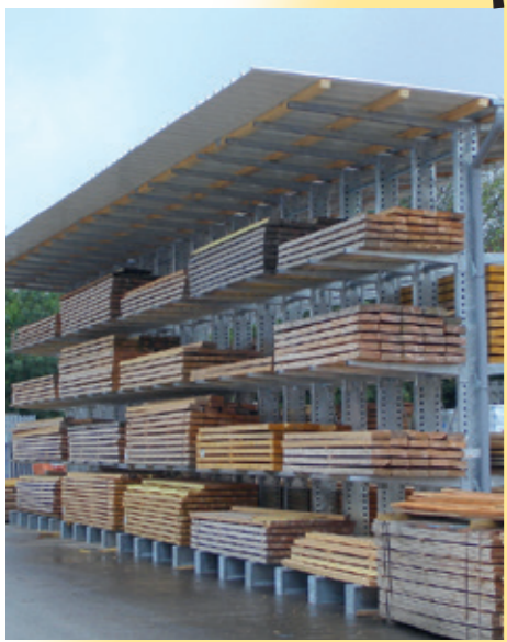
Rayonnage cantilever galvanisés à chaud pour charges lourdes en extérieur