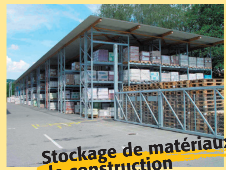
Stockage de matériaux de construction