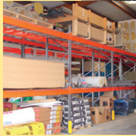
Entrepôt de rayonnages à palettes