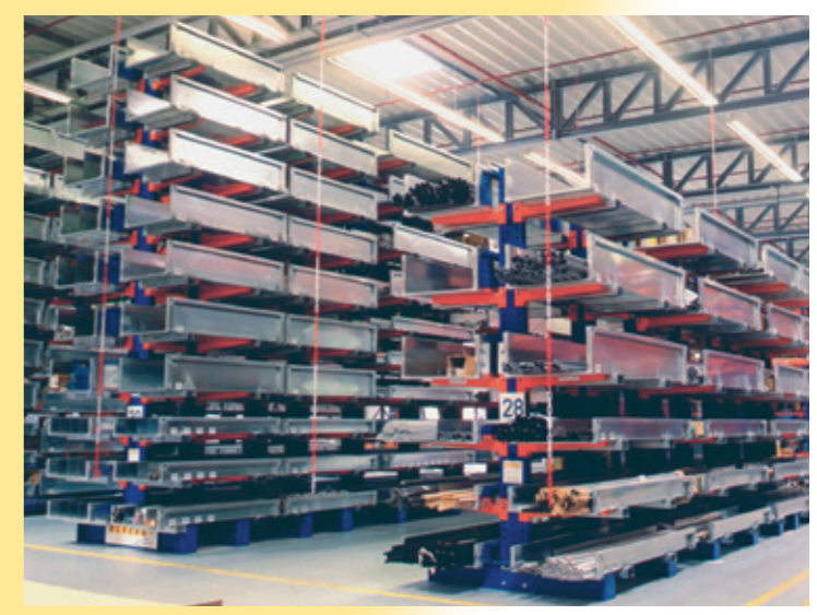
Stockage de l'acier