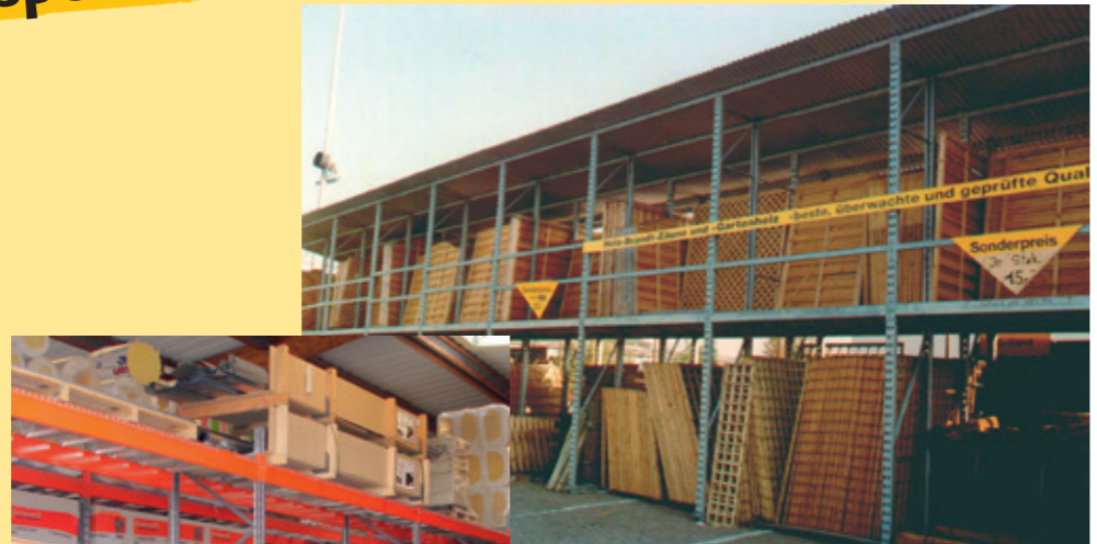
Bois de jardin sur deux niveaux avec zone de préparation