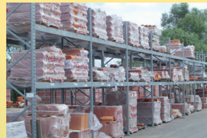
Rayonnage à palettes avec niveaux de préparation