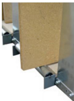
Metallrollen mit Kugellager

Für Ihre wertvollen grossformatigen Platten baut ELVEDI Ihnen das geeignete Plattenlager. Durch unser Baukastensystem bleiben Sie stets flexibel. So lagern Sie Ihre Platten schonend und geordnet und haben jederzeit einen schnellen Zugriff.