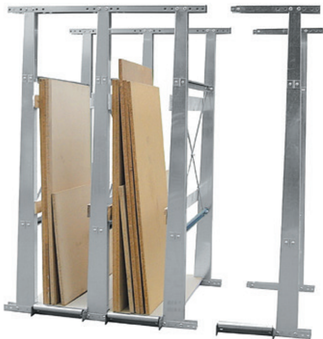
Grundregal mit Anbaumodul